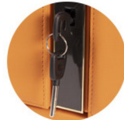
LLAVE DE ANULACION SUMINISTRADA PARA EMERGENCIA