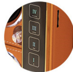
CONFIGURACION FACIL DE CODIGO MEDIANTE EL BOTON DE REINICIO