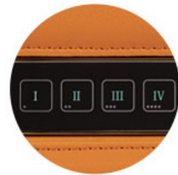
CONFIGURACION FACIL DE CODIGO MEDIANTE EL BOTON DE REINICIO