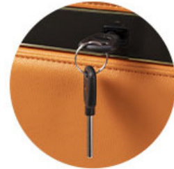
LLAVE DE ANULACION SUMINISTRADA PARA EMERGENCIA