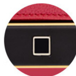
REGISTRO FACIL DE HUELLAS DACTILARES MEDIANTE EL BOTON RESET