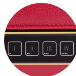
CONFIGURACION FACIL DE CODIGO MEDIANTE EL BOTON DE REINICIO