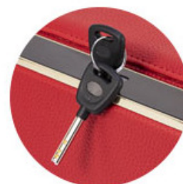
LLAVE DE ANULACION SUMINISTRADA PARA EMERGENCIA